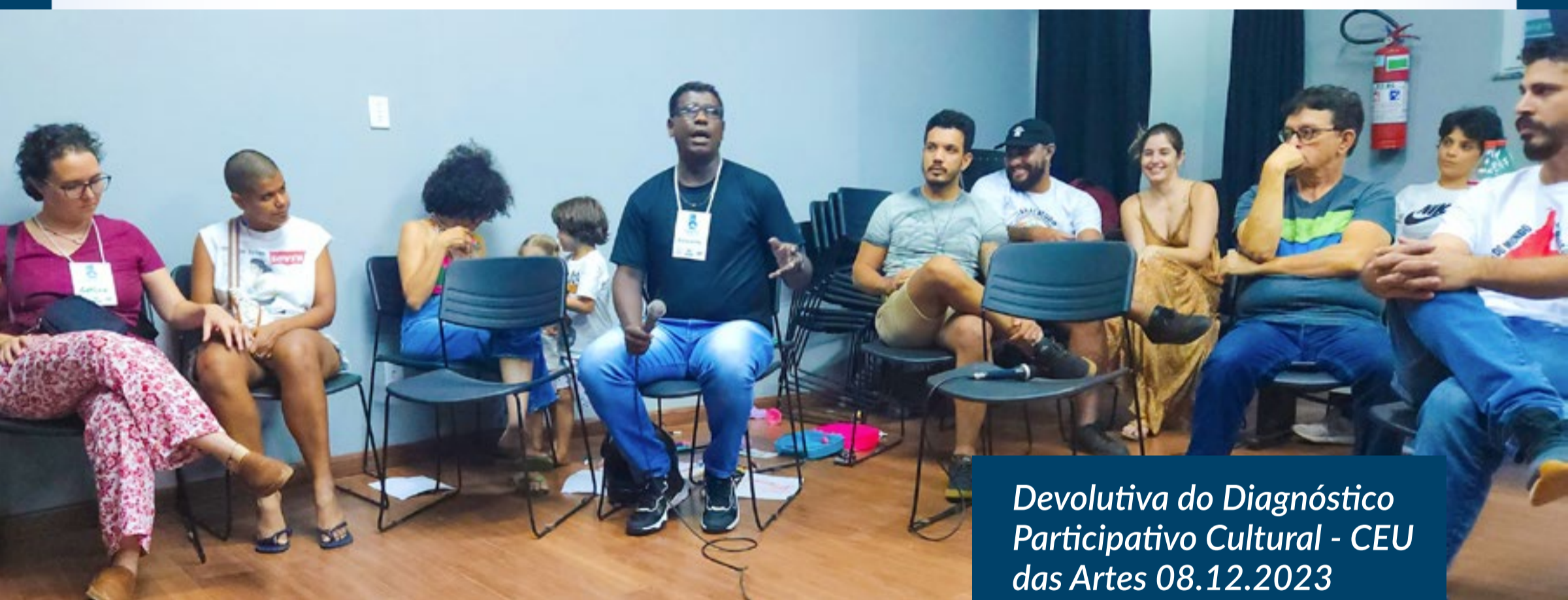
Devolutiva do Diagnóstico Participativo Cultural - CEU das Artes 08.12.2023

O Galpão Cine Horto identificou problemas crônicos no setor cultural de Governador Valadares, incluindo a desvalorização do trabalho artístico pela sociedade e poder público, conservadorismo exacerbado, violação de direitos humanos e falta de reconhecimento do trabalho do artista como profissão. A ignorância social, baixa escolaridade e falta de acesso à cultura agravam a situação, gerando enfraquecimento do setor cultural e desunião no setor artístico.