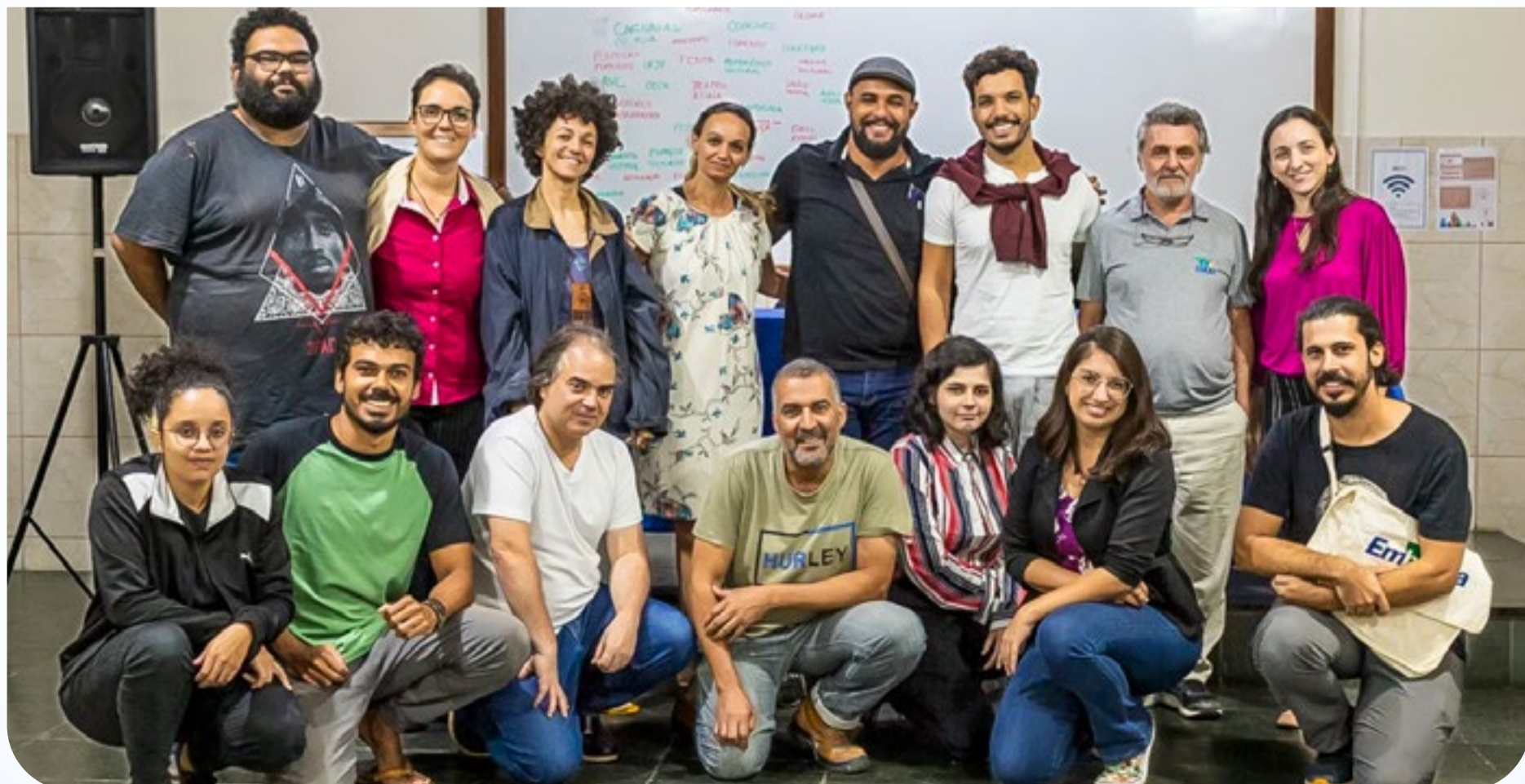
Reunião realizada no dia 19.05.2023